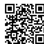
AlmaLaurea per i laureati

Orientamento per gli studenti di scuola media superiore. Le Indagini sul Profilo e la Condizione occupazionale dei laureati di AlmaLaurea hanno permesso al Consorzio di mettere a punto AlmaOrientati , un percorso di orientamento alla scelta universitaria realizzato da un team di esperti (psicologi, statistici e sociologi). Il percorso AlmaOrientati, a disposizione dei diplomati per aiutarli a compiere la scelta giusta, è disponibile su www.almaorientati.it