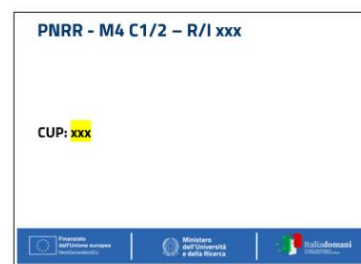
Dimensione: 7x5 cm