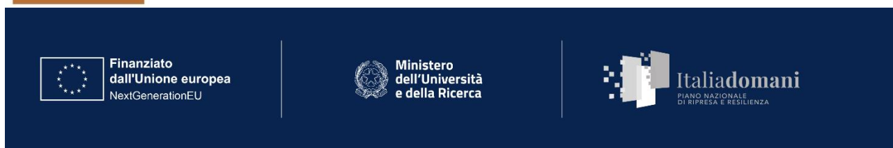
Rappresentazione del logo firma