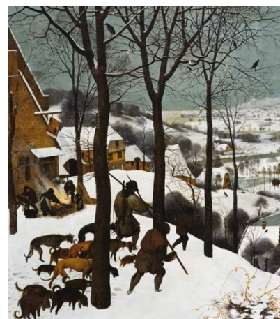
Il ritorno dei cacciatori - Brueghel il Vecchio, 1565

Aula A1.6 Edificio Ricamo, Coppito 1 Link: https://univaq.webex.com/meet/alfredodavide.ferella